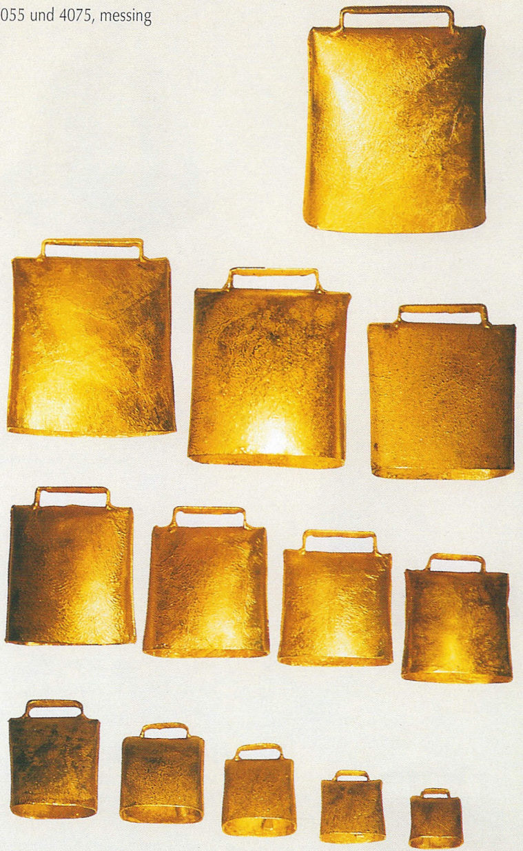
Herdenglocken, Größe 4-16, vermessingt, Art.-Nr. 370/4-16/FM