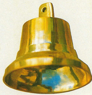
Messingglocke Form 41