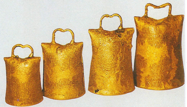
Herdenglocken, Größe 5-8, feuervermessingt Art.-Nr. 360/5-8/FM