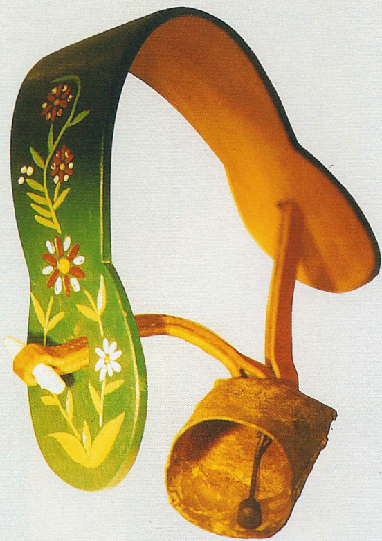
Herdenglocke mit Holzbügel, Größe 15, feuervermessingt Art.-Nr. 360/15/FM