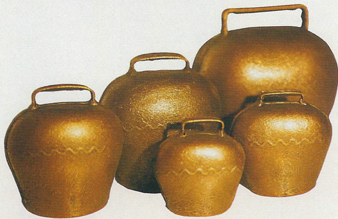
Herdenglocken, Größe 5-10, antik-kupfer Art.-Nr. 385/5-10/AM