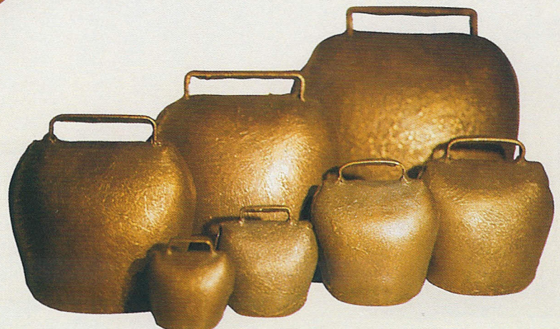
Herdenglocken, Größe 4-16, antik-messing, Art.-Nr. 367/4-16/AM