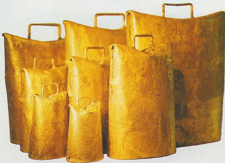
Herdenglocken, Größe 9-25, feuervermessingt Art.-Nr. 360/9-25/FM