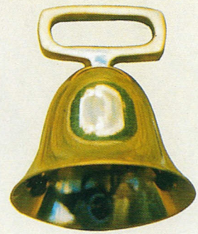
Messingglocke Form 40

... wenn der Dorfhirte seine Herde austreibt und das Geläut der Glocken erhält, dann ziehen die „vierbeinigen Musikanten“ hinaus auf die Wiesen und Weiden.