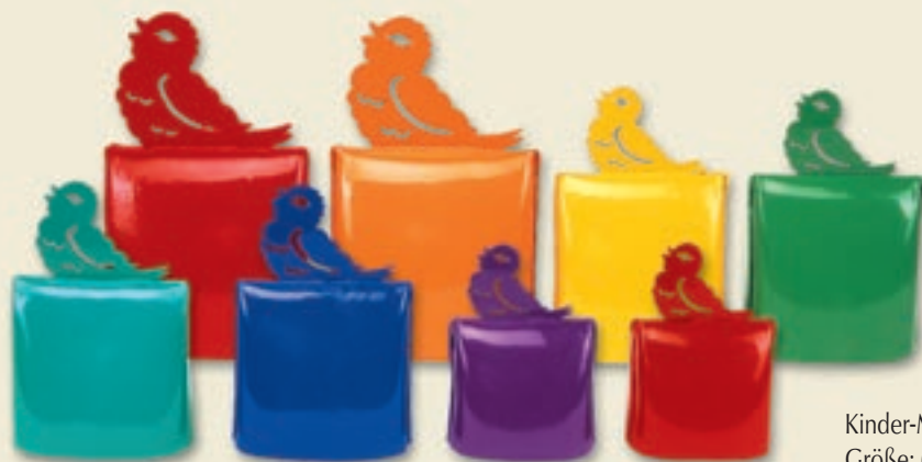
Kinder-Musik Glocken (farbig), pulverbeschichtet Größe: 6 bis 16 cm

Diese feuervermessingten Glocken können in den Tönen c 4 bis f 4 chromatisch abgestimmt und geliefert werden.