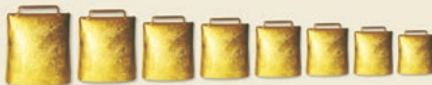
Musik-Glocken (Glockensatz C-Dur), vermessingt Größe: 6 - 16 cm, 8-teilig

Diese feuervermessingten Glocken können in den Tönen c 4 bis f 4 chromatisch abgestimmt und geliefert werden.